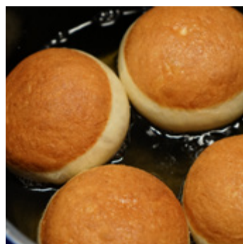
... fertig backen